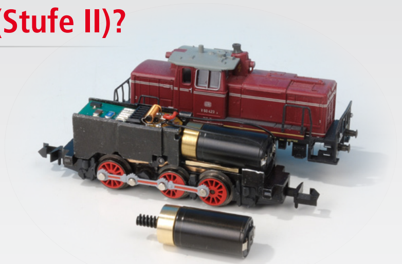
Minitrix (N) V 60/BR 261 sb-Nr. 3054n

Jedem Satz liegt eine farbig bebilderte Umbauanleitung bei, die einfache